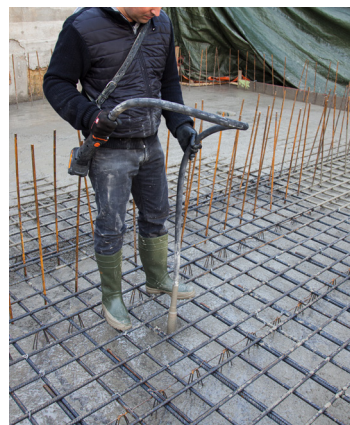
Light weight and effective