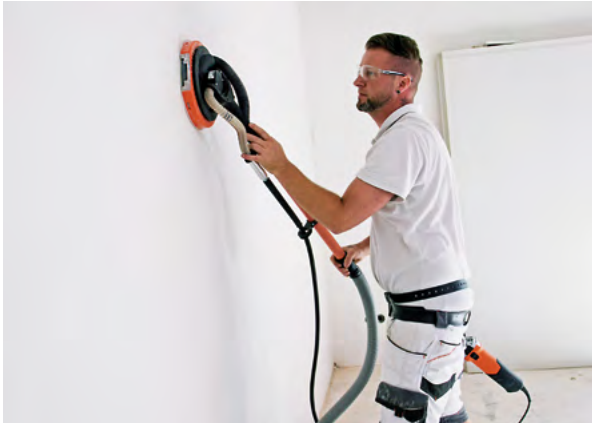
Τρίβει μεγάλες επιφάνειες πολύ γρήγορα