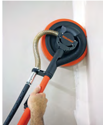
Τρίψιμο σε γωνία