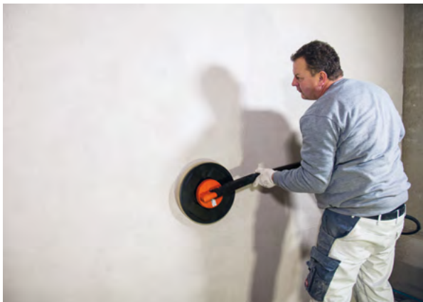
Με νέα τεχνολογία κινητήρα: Δυνατότητα ελέγχου της χαμηλότερης ταχύτητας, για τέλειο σχηματισμό επιφανειών