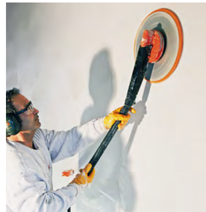
Άνετη εργασία λόγω του μικρού βάρους του εργαλείου