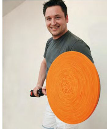
230 στροφές ανά λεπτό