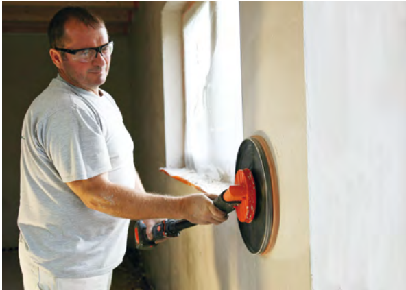
Άνετο τρίψιμο σε μεγάλες επιφάνειες τοίχων