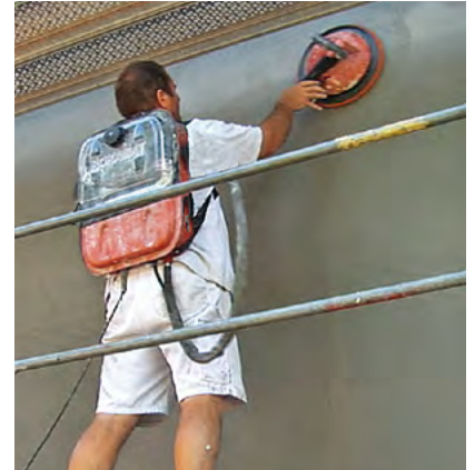
Easy working on scaffolding