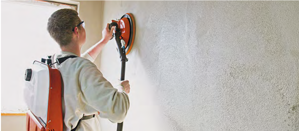
No extra water supply needed