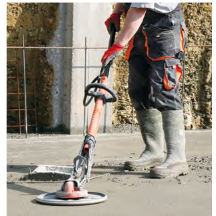
Εργασία φιλική προς τη σπονδυλική στήλη