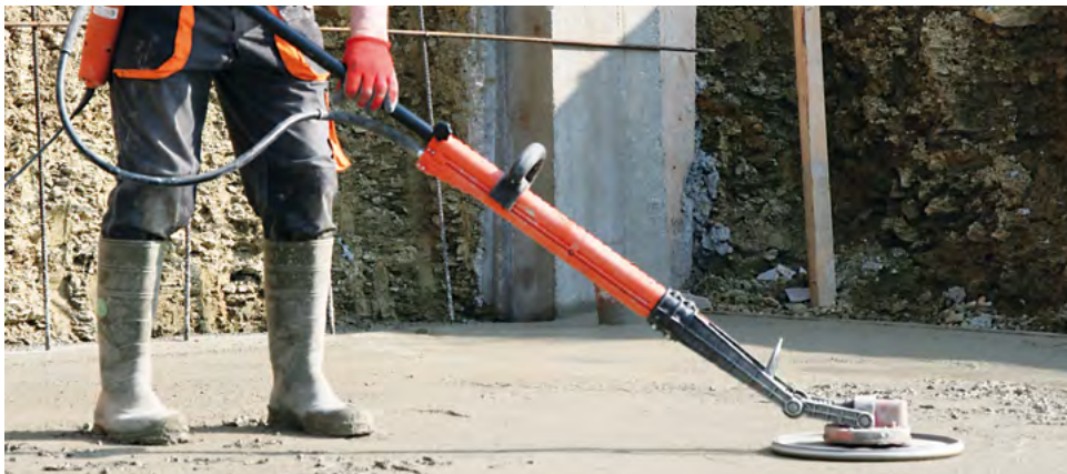
Επιπεδοποίηση φρέσκου μπετού